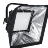
ML800SBRM SnapBag Medium