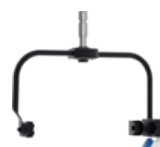
ML801P Lyre avec commande par perche