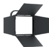
ML801BD2 Volets 4 faces