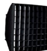
ML801G40SB SnapGrid 40 ° pour SnapBag